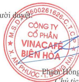
Phan Hồng Sơn Chủ tịch

Các thuyết minh đính kèm là bộ phận hợp thành của báo cáo tài chính này